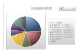
実績情報 延床面積別建物数

業務の実績情報から、技術者の経歴リストやプロジェクトの実績情報などが把握できます。また、類似物件の営業時だけでなく現在の業務管理時にも活用できます。さらに、地震災害が起きた際の建物検索や、アスベスト対策、エレベーターの事故対策時の検索などにも効果を発揮します。