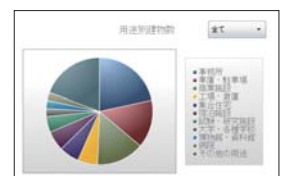
実績情報 用途別建物数